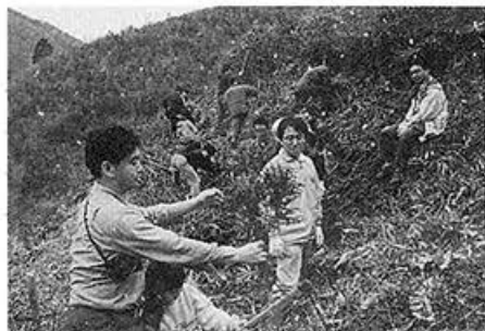
●第1回「自然と親しむ会」能勢町で植林。 「私にもやらせて！」（1992年4月5日）