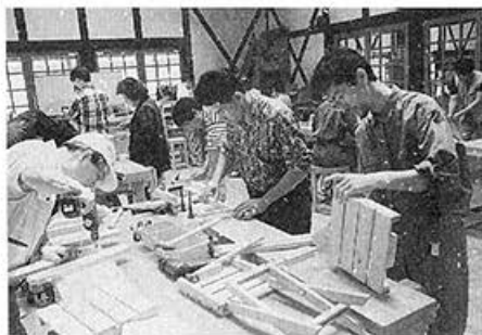
●第2回「自然と親しむ会」河内長野で間 伐材利用の木工。日曜大工で鍛えた腕の さえを見よ。（1992年6月28日）