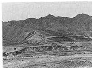
緑の極端に少ない黄土高原の山なみ (中国山西省)