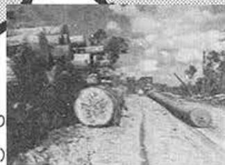
熱帯雨林から伐り出された巨大な原木 (マレーシア)