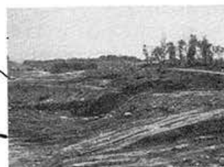
ぜいたくが緑を奪う……造成中のゴルフ場