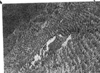
荒廃の進む日本の森林