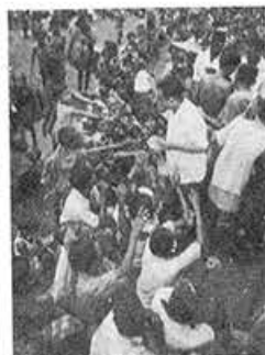
大洪水のあと、給食をうける子どもたち (バングラデシュ)