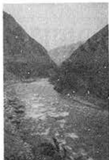
水土流出の著しい中国四川省の河

日本の緑も危ない状態にあります。ゴルフ場をはじめとするリゾート開発が自然の緑を奪い、林業切り捨て政策のもとで森林の荒廃が深まっています。自分の国の緑を守れなくて熱帯雨林を問題にする資格はない、という議論もありますが、地球環境に国境はなく、それを守ろうとする民衆にも国境はないはず。自然を大切に思う人と人との連帯こそが、緑の地球を守り再生させる力であり、貧困と戦乱をなくす力だと思ふのです。