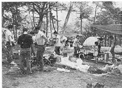
●台風になげず、キャンプに参加した強者 たち。（1992年8月9日）