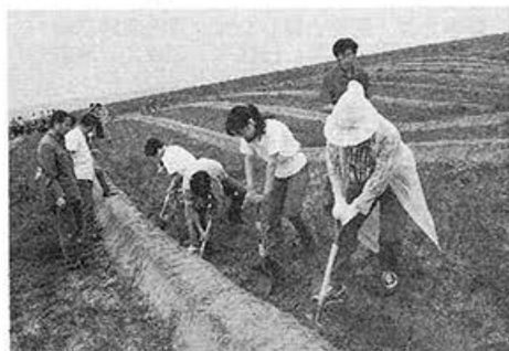
●第2次緑化協力団（1992.8.1～8.12） 渾源泉西留郷・恒山・苗圃・大同県徐町郷で植樹活動に参加。写真は西留郷で。