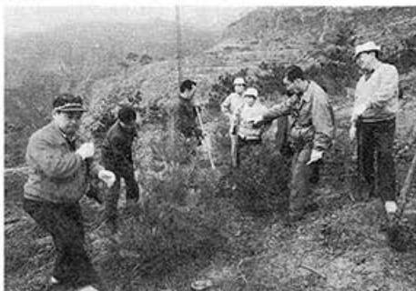
●第1次緑化協力団（1992.5.6～5.18） 山西省渾源泉西留郷をはじめ桑干河緑化プロジェクト等の考察、及び緑化基金を現地に届ける。写真は恒山で。

ワーキングツアーの派遣など協力をつづけながら、すぐ近くを流れる桑干河（北京などの水源）流域の緑化事業にも93年から関係を拡大することで現地と合意ができています。