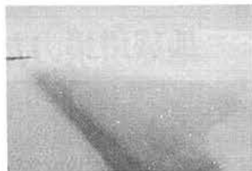
中国内陸部の広大な沙漠