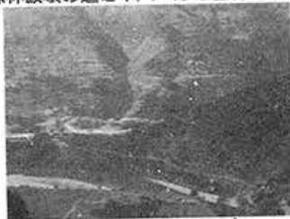
森林破壊の進むネパールの山村地域