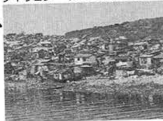
フィリピン・マニラのスラム街